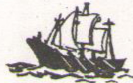
18. पानी का जहाज